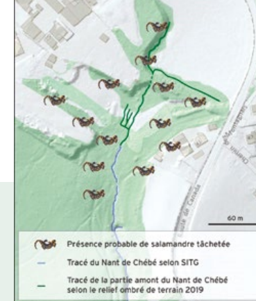
Population de salamandres tachetées fortement menacée par un grand projet routier à Satigny.

Pro Natura Genève a fait recours contre la décision de l'État de ne pas constater ce biotope digne de protection.