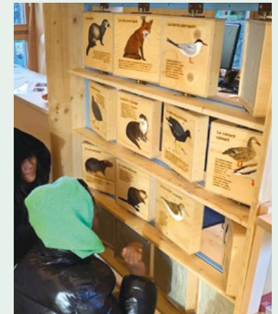
Nouvelle animation en libre-service des empreintes au Centre Nature de la Pointe à la Bise.