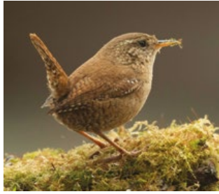
Troglydite mignon ( Troglodytes troglodytes )