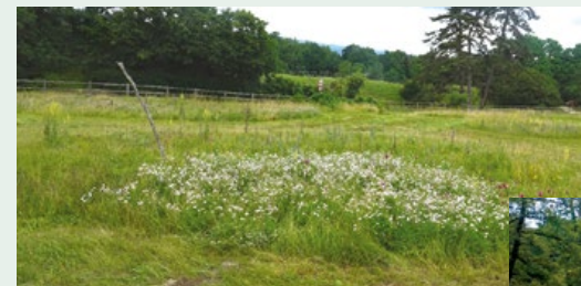
Une fauche tardive et sélective permet de maintenir des faciès de végétation en pleine floraison qui permet à ces espèces d'effectuer l'intégralité de leur cycle de vie d'une part, et offrent, d'autre part, le gîte et le couvert à de nombreuses espèces d'insectes (ci-contre).