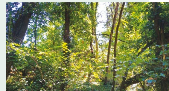
Bosquet à Bellevue avec des strates arbustives et herbacées bien marquées.