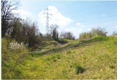
Réserve naturelle de la Petite Grave (ci-dessus).