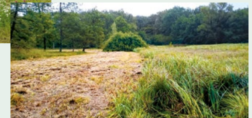
Faucher partiellement des grandes surfaces de cariçaies comme ici, aux Prés-de-Villette, permet de maintenir ouvert ce marais et offre ainsi la possibilité à de nombreuses espèces de se maintenir et de se développer dans cet écosystème remarquable (ci-contre).