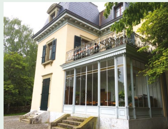
Chemin de Plonjon 4, 1207 Genève

La prestation en nature est évaluée à CHF 9'556.-.