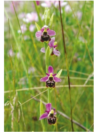
Ophrys bourdon ( Ophrys holosericea )