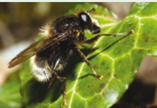
Syrphe des forêts caducifoliées ( Criorhina ranunculii ), inféodés aux chênaies (ci-contre).