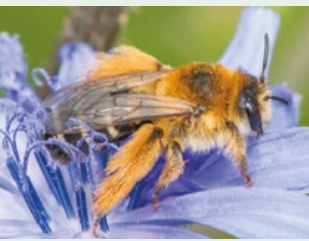
La Dasyode à culottes ( Dasypoda hirtipes ): cette abeille solitaire visite les Astéracées. Les pattes arrière couvertes de longs poils dorés donnent l'impression qu'elle porte un pantalon. Elle niche typiquement dans les zones sableuses (ci-contre).

Par suite du projet de revitalisation de l'ancienne gravière de la petite Grave, la mise en place de prairies sèches, de haies indigènes, de plans d'eau pionniers ou le maintien d'autres habitats aquatiques plus anciens a permis d'offrir des habitats intéressants à de nombreuses espèces. Les abeilles sauvages ainsi que les Syrphidés ont ainsi été inventoriés en 2023 afin d'évaluer le potentiel d'accueil des habitats pour ces pollinisateurs.