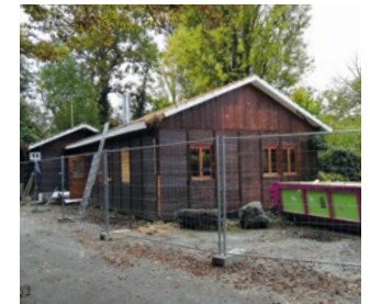
Le bâtiment avant démontage (ci-dessus) et les travaux en cours (ci-contre)

Le mobilier et le matériel du bâtiment ont été triés, vidés et déplacés pour permettre le début des travaux. La bâtisse a été démontée petit à petit afin de garantir la survie d'un maximum d'habitants, blottis sous les tuiles ou sous les lambris de la façade, soigneusement déplacés dans les tas de bois et de feuilles. Les nichoirs, délaissés par leurs occupants à cette période, ont été décrochés et nettoyés et seront reposés dès que possible. La haie bordant le bâtiment a été mise en jauge afin que l'on puisse la conserver, puis la replanter une fois la construction achevée. Le Centre rouvrira probablement ses portes en début d'été 2020 pour pouvoir accueillir les activités d'éducation à la nature dès le mois de juillet.