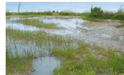
La réserve de la Pointe à la Bise avant et après travaux